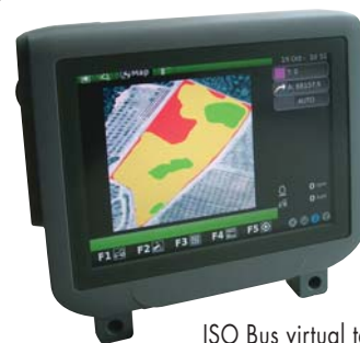
ISO Bus virtual terminal

Nell'intento costante di migliorare le caratteristiche e le prestazioni delle proprie apparecchiature, SPEZIA s.r.l. si riserva il diritto di modificare anche senza preavviso le specifiche tecniche. L'effort continu pour améliorer les fonctionnalités et les performances de leur équipement, SPEZIA s.r.l. se réserve le droit de modifier sans préavis les spécifications techniques. The continuing effort to improve the features and performance of their equipments, SPEZIA s.r.l. reserves the right to change the technical specifications without notice.