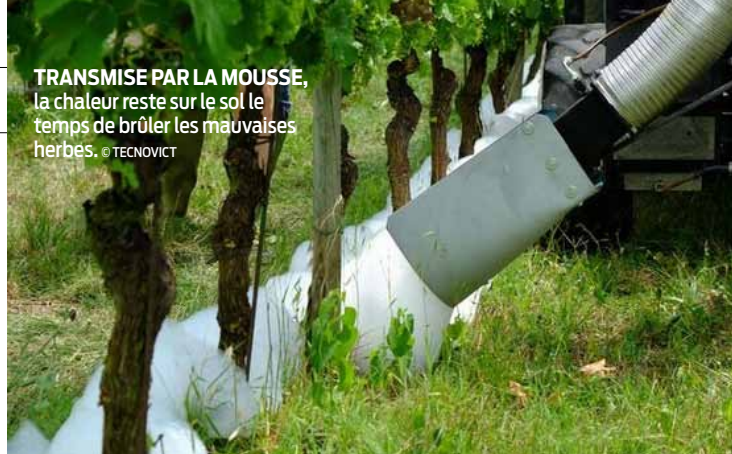
TRANSMISE PAR LA MOUSSE, la chaleur reste sur le sol le temps de brûler les mauvaises herbes.