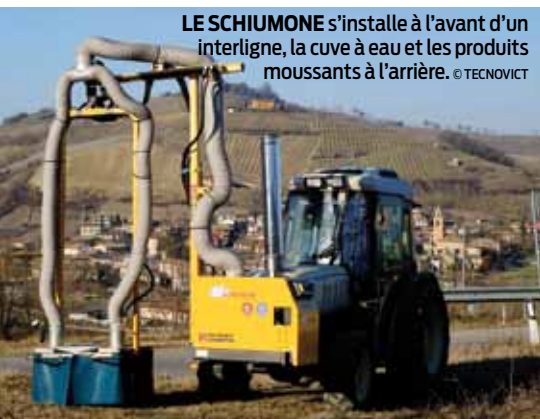
LE SCHIUMONE s'installe à l'avant d'un interligne, la cuve à eau et les produits moussants à l'arrière.

▶ Visionnez une démonstration sur www.vitisphere.com